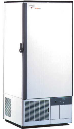
ProfiLine PLECU 51865